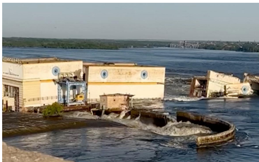
Разрушенная плотина Каховской ГЭС

Киевский режим, подорвав дамбу Каховской ГЭС, совершил немыслимое преступление, Организация Объединенных Наций (ООН) при расследовании не должна повторить ошибок, как в случае с украинской провокацией в Буче и подрывом газопроводов "Северный поток" и "Северный поток - 2".